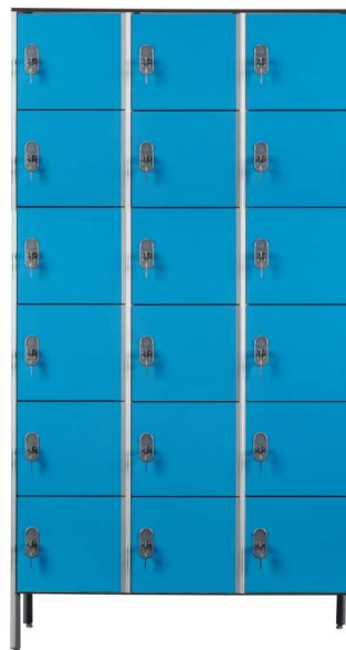
ARMADIO CON ANTE CHIUSE