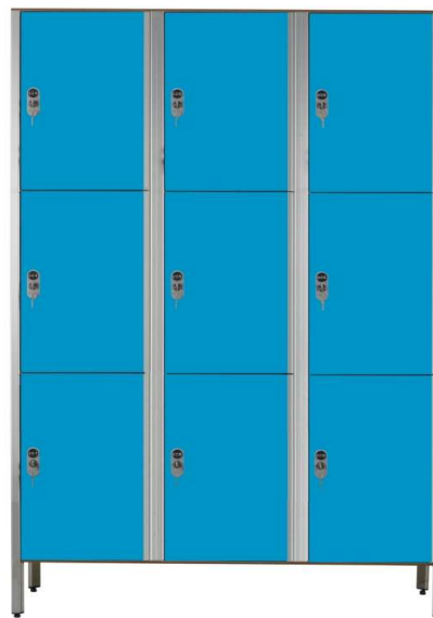
ARMADIO CON ANTE CHIUSE